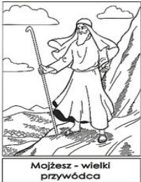
Mojżesz - wielki przywódca

Cykl lekcji o Mojżeszu (z lekcjami, kolorowanymi, łamigłówkami, zajęciami interaktywnymi itp.) Rysunki i łamigłówki są prawie gotowe. Jeśli chodzi o lekcje, jesteśmy na półmetku. Chcemy zdążyć do końca lipca, żeby program był gotowy na rok szkolny.