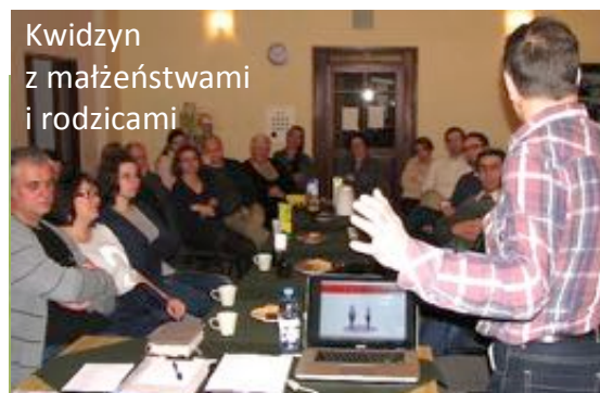
Kwidzyn z małżeństwami i rodzicami

Dziękujemy Ci za modlitwy! Lato za pasem, życzymy Ci dobrego wypoczynku i takich przygód, które pozwolą Ci zobaczyć wielkość Boga i odczuć Jego troskę! Pozdrawiamy gorąco,