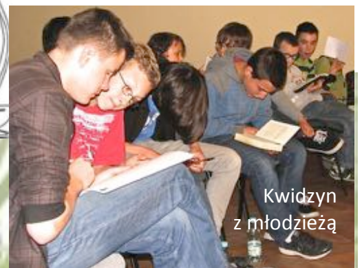
Kwidzyn z młodzieżą

Dziękujemy Ci za modlitwy! Lato za pasem, życzymy Ci dobrego wypoczynku i takich przygód, które pozwolą Ci zobaczyć wielkość Boga i odczuć Jego troskę! Pozdrawiamy gorąco,