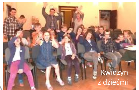
Kwidzyn z dziećmi